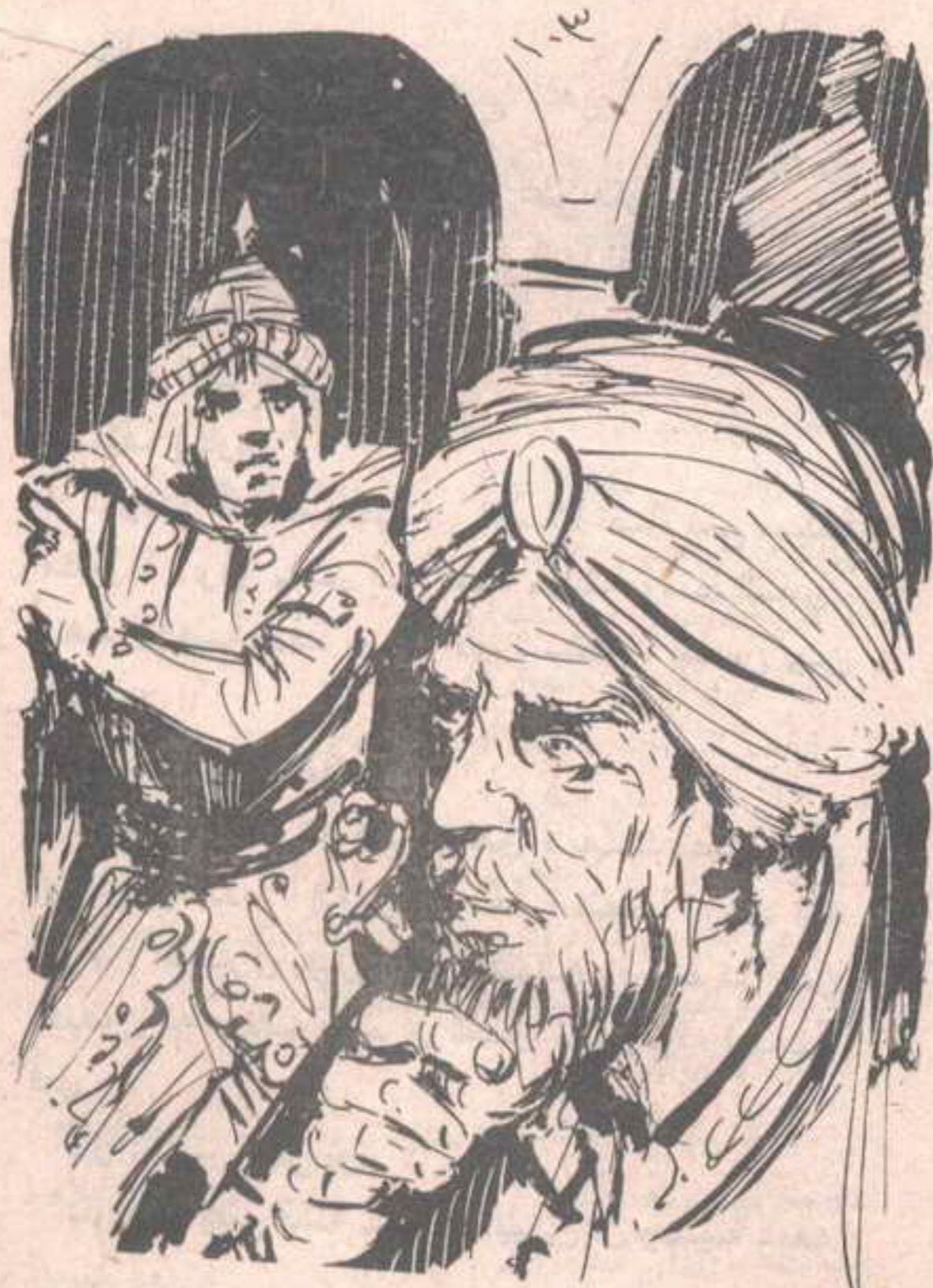
انعقد حاجبا الشيخ في اهتمام ، وهو يستمع إلى ( فارس ) ..

انعقد حاجبا الشيخ في اهتمام ، وهو يستمع إلى ( فارس ) ، الذي يقول بلهجة ملوفا الحنق والضيق : - ولقد عثروا على جثتي ( شيلوك ) و ( راشيل ) في الساعات الأولى من الصباح ، داخل جوالين في السوق ، وكل محاولتنا لتعقب ذلك القشتالي باءت بالفشل .. لا أحد من الخدم رآه أو سمع شيئا عنه . هز الأمير رأسه ، قائلا :